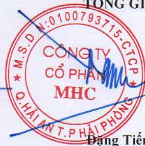
Đặng Tiến Thành